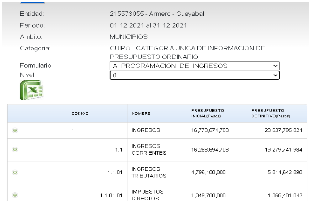
Figura 2. Exportación de información programación de ingresos.

Seguidamente a consultar y seleccionar el nivel 8, se exporta la información a Excel para mayor facilidad de la información.