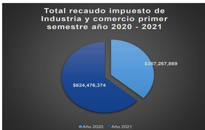
Figura 6. Recaudación ICA comparativo primer semestre año 2020-2021

Fuente: Alcaldía de Armero Guayabal (2021a).