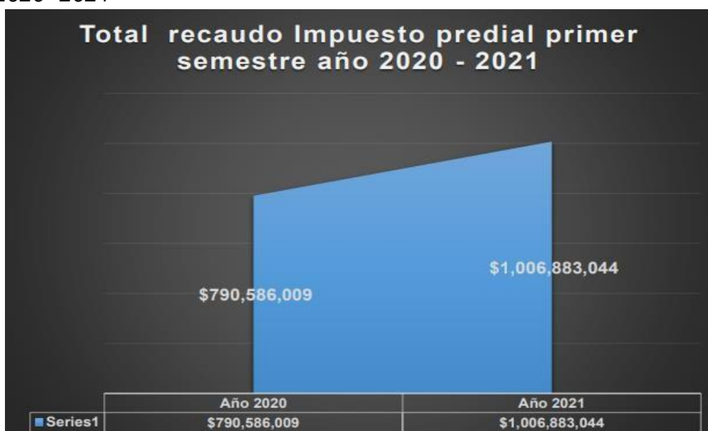
Figura 7. Recaudación impuesto predial comparativo primer semestre año 2020 -2021

Fuente: Alcaldía de Armero Guayabal (2021a).