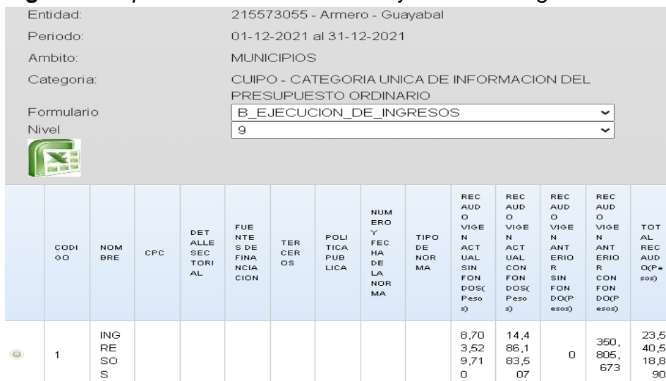
Figura 3. Exportación de información ejecución de ingresos.

De igual modo para encontrar la información de los ingresos ejecutados, se selecciona el formulario de ejecución de ingresos y el nivel 9.