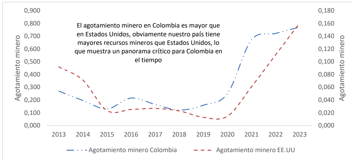
Figura 3. Relación del agotamiento minero de Colombia y Estados Unidos, 2013-2023.

Las operaciones mineras, especialmente las llevadas a cabo por multinacionales han causado daños ambientales graves en Colombia, incluyendo la desertificación, contaminación del agua y aire, y la pérdida de biodiversidad.