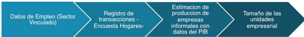
Figura 1. Caracterización de datos e indicadores utilizados para la estimación de la empresa informal en el Mundo